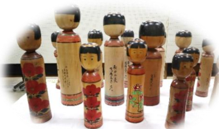
数十本のこけしが並びました。